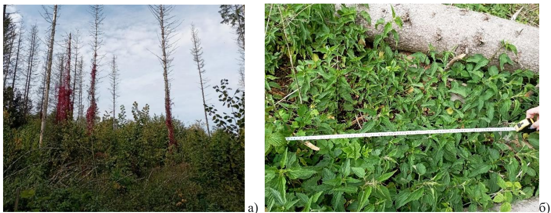
Рис. 4. Північна межа ПП-17: а) дикий виноград п'ятилистий на мертвій деревині ялини європейської (25.09.2022); б) зарості кропив дводомної на північній точці (28.05.2022)