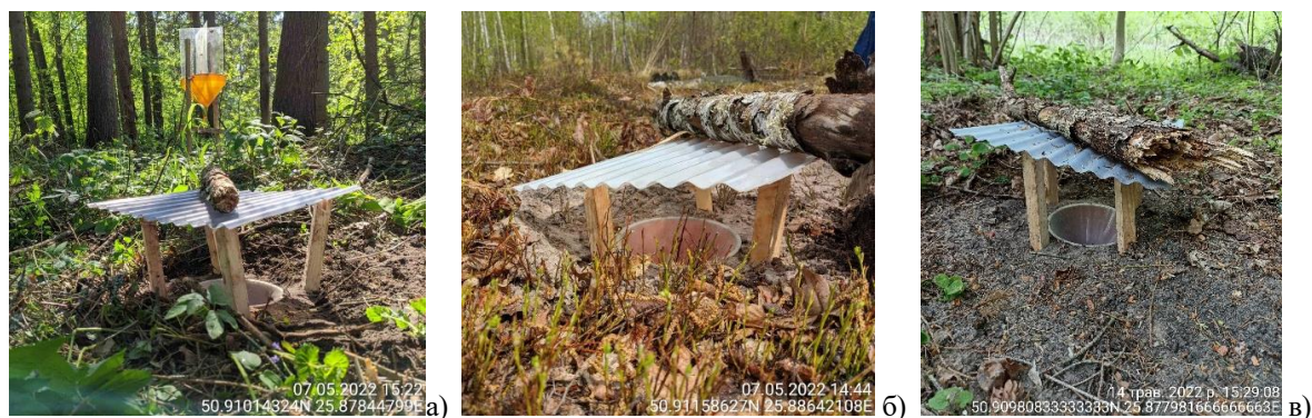
Рис. 2. Ґрунтові пастки на ділянці ялинового лісу: а – ПП-16, б – ПП-17, в – ПП-18

Збір матеріалу проводився шляхом обліків тварин на пробних площах (ПП). Кожна ПП складалася з трьох пасток Барбера (пластикові банки, об'ємом 0,5 л, закопані в ґрунт так, щоб верхній край був рівний із поверхнею ґрунту), розташованих на відстані 50 м одна від одної (рис. 2). Над пасткою встановлювався дах, щоб у пастку не затікала вода [40].