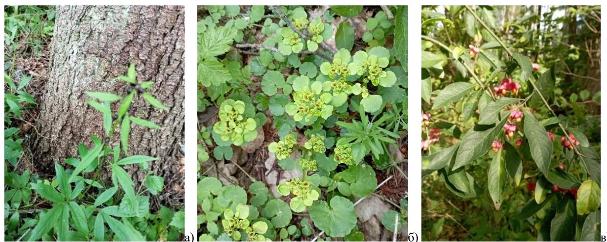
Рис. 3. Трав'яний покрив: а) зубниця бульбиста (ПП-16); б) жовтяниця черговолиста (ПП-16); в) бруслина європейська (ПП-18)

ваних видів судинних рослин у центральній частині виявлено куртину зубниці бульбистої ( Dentaria bulbifera ) 3м x 5м (рис. 3а), у мікропониженні поруч значну участь в угрупованні беруть гравілат річковий ( Geum rivale ), слабник водяний ( Myosoton aquaticum ), жовтяниця черговолиста ( Chrysosplenium alternifolium ) (рис. 3б). Також тільки в межах цієї ПП поодинокі виявлена адокса мускусна ( Adoxa moschatellina ), анемона дібровна ( Anemone nemorosa ), бутень запашний ( Chaerophyllum aromaticum ), вербозілля лучне ( Lysimachia nummularia ), вероніка дібровна ( Veronica chamaedrys ), веснівка дволиста ( Maianthemum bifolium ) герань Робертова ( Geranium robertianum ), жовтеці їдкий ( Ranunculus acris ), кашубський ( R. cassubicus ) і повзучий ( R. repens ), круціата гола ( Cruciata glabra ), пижмо звичайне ( Tanacetum vulgare ), ситник розлогий ( Juncus effusus ).