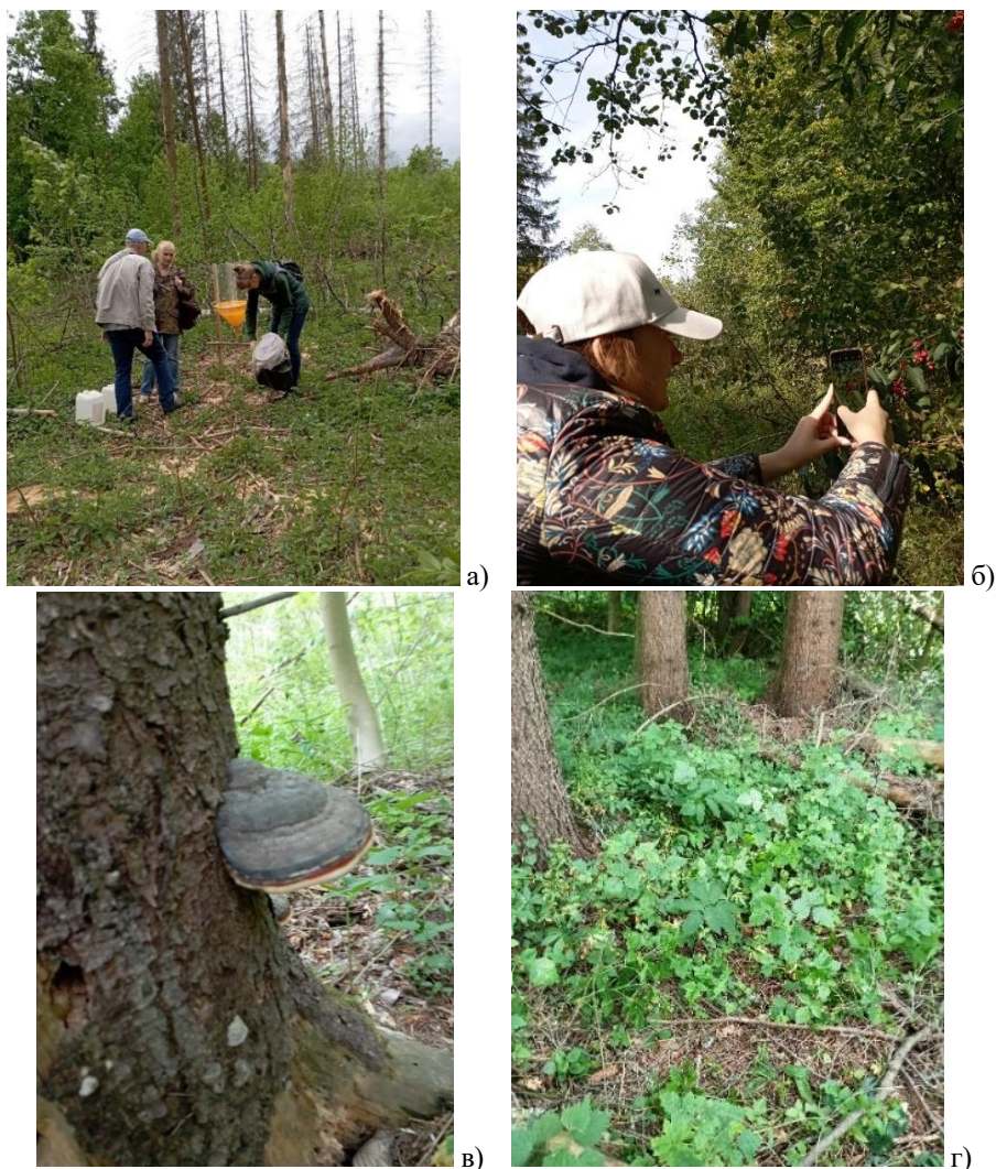
Рис. 1. Польові дослідження : а) ентомологічні збори; б) фотографування; в) фотофіксація ураження ялини європейської ( Picea abies ) трутовиком облямованим ( Fomitopsis pinicola (Sw.) P.Karst.); г) «вікно» ПП-16

Судинні рослини досліджували за стандартними геоботанічними методиками під час маршрутних обстежень з допомогою визначника [35]. Номенклатура таксонів наведена за С. Л. Мосякіним і М. М. Федорончуком з урахуванням системи АРГ IV і даних електронної бази судинних рослин кафедри ботаніки і методики викладання природничих наук [36, 37, 38]. Географічні елементи аналізували за класифікацією Ю. Д. Клеопова [39].